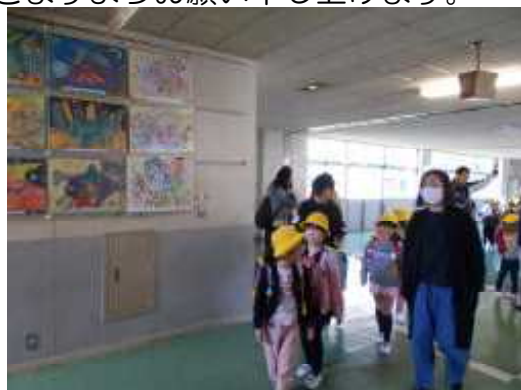
【方面ごとに下校を開始】