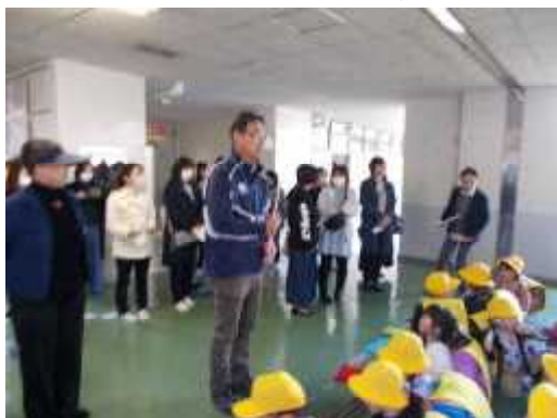
【下校の説明を聞く様子】

子どもたちの安全のために、ご尽力いただきありがとうございました。今後とも、できる時に、できることをお手伝いいたしますようお願い申し上げます。