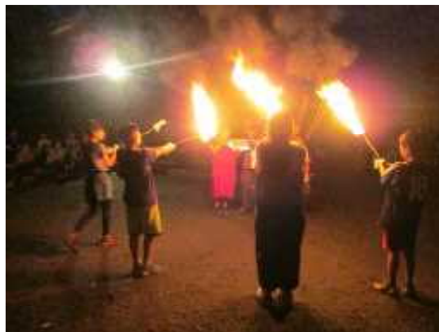
【火の神登場で 盛り上がったキャンプファイヤー】