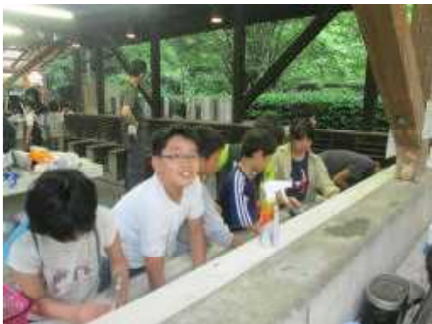
【協力して作ったカレー】

子どもたちは、桐生の大自然に親しみ、共同生活を通して主体的に活動することや協力することの大切さを学んできたように思います。来年度の修学旅行に学んだことを活かしてほしいと思います。