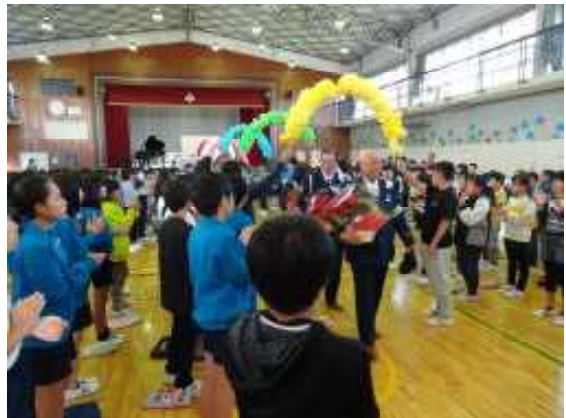
【アーチをくぐって退場する様子】