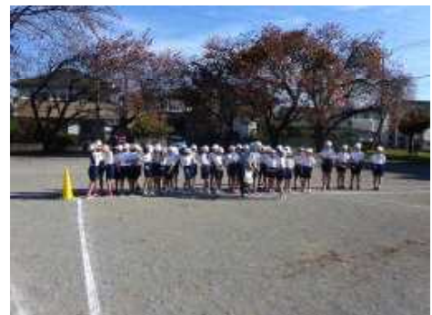
【スタートラインに並ぶ子どもたち】

たくさんの保護者様の応援やご協力のおかげで、安全に力走できた子どもたちに大きな拍手を送りたいと思います。保護者や交通指導員の皆様、ありがとうございました。