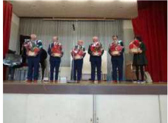
【鉢花をお渡しした直後の皆さんの様子】

感謝の言葉は「ありがとう」や「ありがとうございます」ですが、元気に挨拶することが、朝交通指導をしてくださる指導員さんや学校に来校してボランティアをしてくださるどんぐりの会の皆さんに対する感謝の言葉となることを話しました。「おはようございます」や「こんにちは」です。元気に挨拶をしていけるとよいと思います。また、態度で表すというのは、交通安全のために朝立ってくださる指導員さんに対しては、交通ルールを守り、飛び出しや道路での遊びをしないこと、そして、どんぐりの会の皆さんが補修してくださる給食エプロンを大切に使うことなどです。感謝の気持ちが育つとよいと思います。