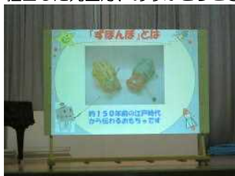
【山田先生による 実験と ずぼんぼの説明】