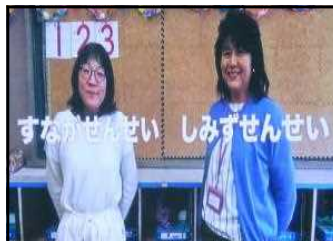
すながせせんせい しみずせんせい