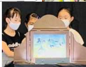
【桐生の民話紙芝居コンテスト】