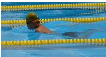
【↑水泳記録会の様子】

夏休み中の課題や作品への取組、ありがとうございました。保護者の皆様のお子様への声かけやご協力によって仕上げる事ができたと思います。もしも、まだ仕上がってなくて悩んでいる場合は、「〇日までに提出します。もう少し頑張ります。」と担任に伝えてください。何よりも、元気に学校に登校できることが一番です。