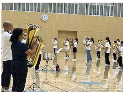
【マーチングの練習】